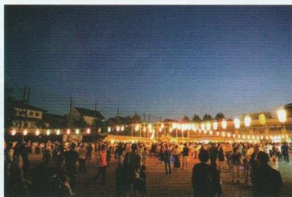
とっぶり日が暮れると、お待ちかね お楽しみ大抽選会の始まりです