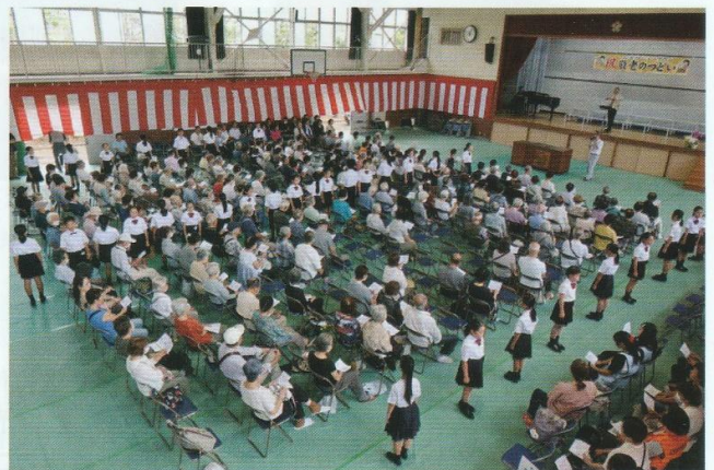
合唱団の子どもたちが観客席の間に立って「ふるさと」を合唱 (指揮: 橋本剛先生 ピアノ: 館山圭子先生)